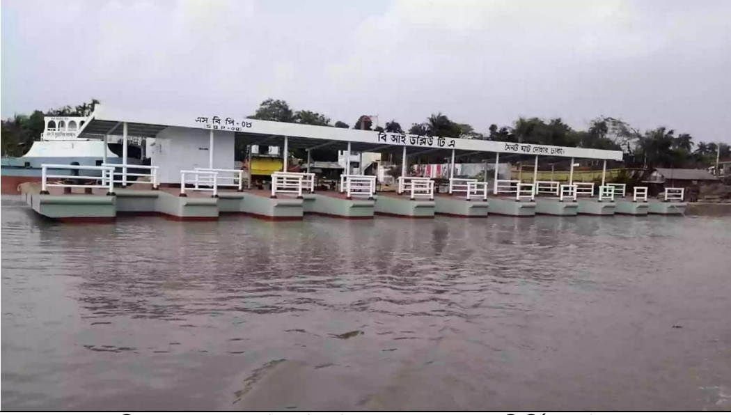
চিত্রঃ কর্তৃপক্ষের মৈনটঘাট, দোহারের জন্য নির্মিত পনটুন