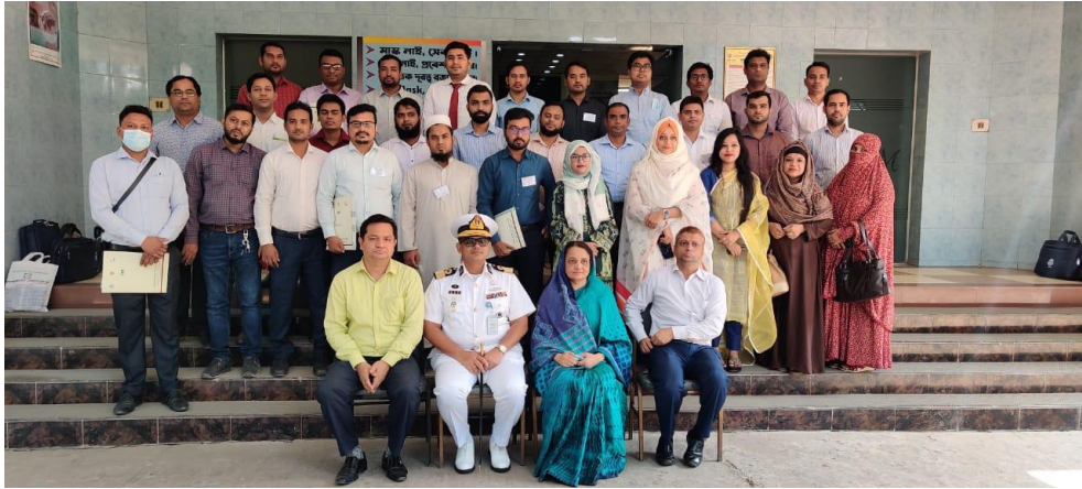
বাংলাদেশ ইন্সটিটিউট অব ম্যানেজমেন্টে বিআইডব্লিউটিএর ১ম ও ২য় শ্রেণীর কর্মকর্তাদের দক্ষতা বৃদ্ধির জন্য বুনিয়াদি প্রশিক্ষণ আয়োজন করা হয়।