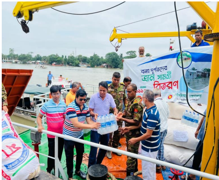
সুনামগঞ্জের বন্যা দুর্গতদের মাঝে বিআইডব্লিউটিএর ত্রান সামগ্রী বিতরণ