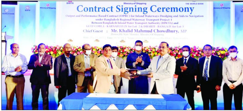
State Minister for Shipping Khalid Mahmud Chowdhury attends an agreement signing ceremony for dredging Chattogram-Dhaka-Ashuganj and connected river routes and establishing terminal along with other establishments funded by World Bank held at Hotel Radisson in the city on Saturday. Secretary of the Shipping Ministry Mezbah Uddin Chowdhury and BIWTA Chairman Commodore Golam Sadek were also present at the ceremony.