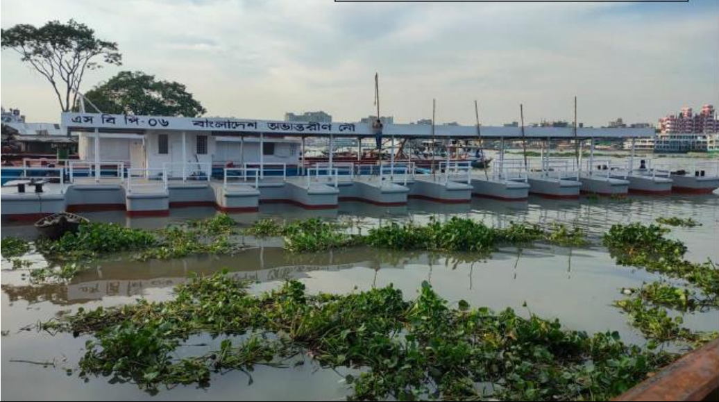
চিত্রঃ কর্তৃপক্ষের কোড়ালিয়া, পটুয়াখালীর জন্য নির্মিত পনটুন