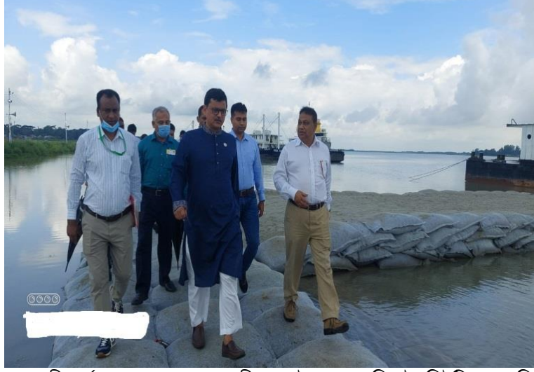
মাননীয় প্রধানমন্ত্রী কর্তৃক ২৫ জুন পদ্মা বহুমুখী সেতু উদ্বোধনের বিআইডব্লিউটিএর প্রস্তুতি পরিদর্শন করছেন মাননীয় নৌ পরিবহন প্রতিমন্ত্রী জনাব খালেদ মাহমুদ চৌধুরী এমপি।