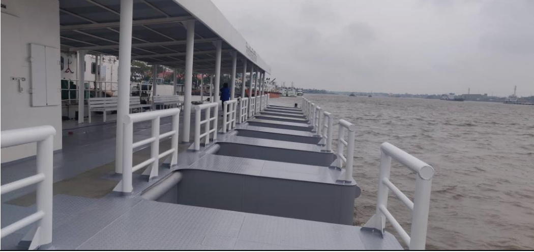
চিত্রঃ কর্তৃপক্ষের লাহারহাট, বরিশালের জন্য নির্মিত পনটুন