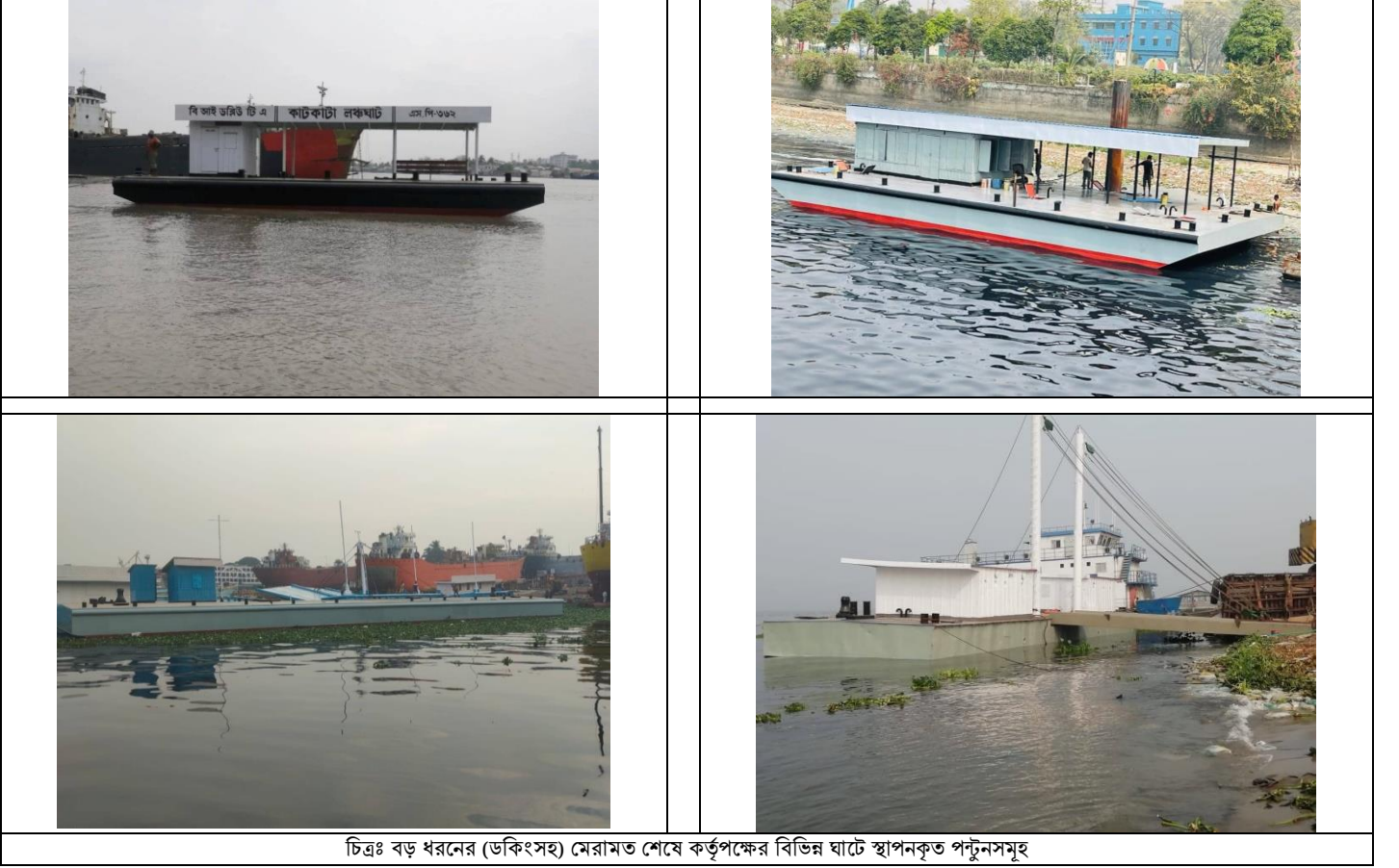
চিত্রঃ বড় খরনের (ডকিংসহ) মেরামত শেষে কর্তৃপক্ষের বিভিন্ন ঘাটে স্থাপনকৃত পল্টুনসমূহ