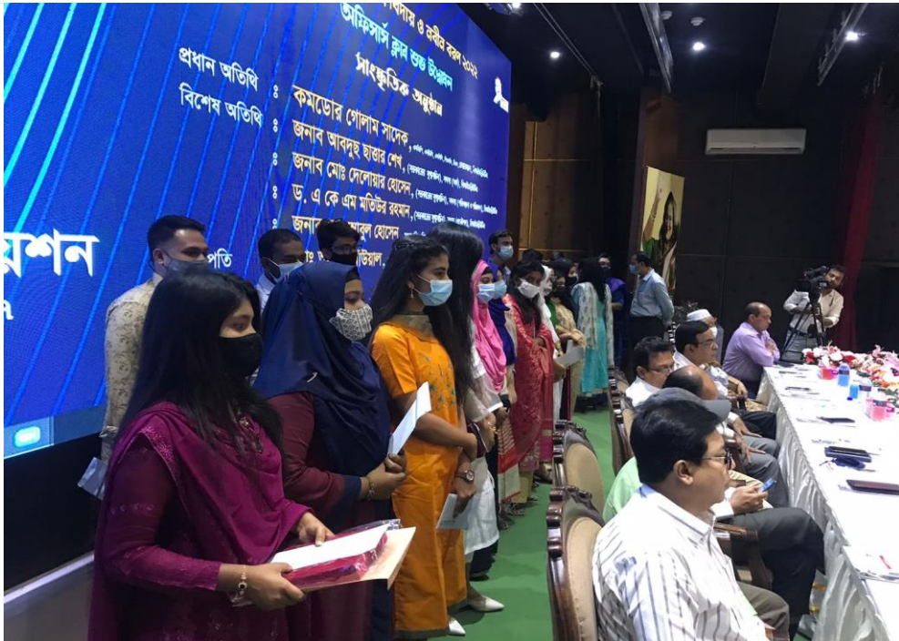
বিআইডব্লিউটিএ অফিসার্স এসোসিয়েশন কর্তৃক কর্মকর্তা ও কর্মচারীদের কৃতী সন্তানদের মাঝে বৃত্তি প্রদান।