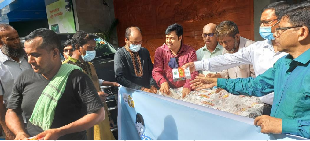
জাতির পিতা বঙ্গবন্ধু শেখ মুজিবুর রহমান এর কনিষ্ঠ পুত্র শেখ রাসেল দিবসে দুস্থদের মাঝে খাদ্য বিতরণ করে বিআইডব্লিউটিএ।