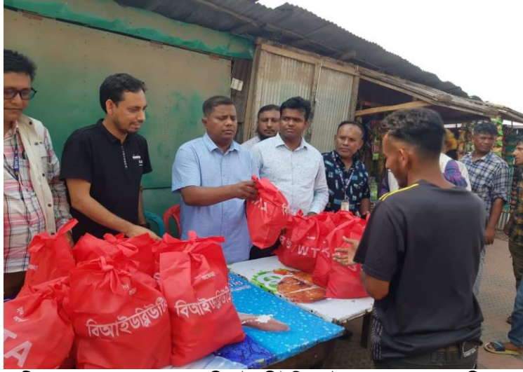
গরীব ও দুস্থ জনগনের মাঝে বিআইডব্লিউটিএ চট্টগ্রাম দপ্তরের খাদ্য বিতরণ।