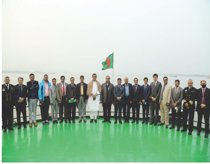
সেমিনার শেষে এক ফ্রেমে আমন্ত্রিত অতিথি এবং নৌপরিবহন মন্ত্রণালয় ও এর সংস্থাগুলোর উর্ধ্বতন কর্মকর্তারা